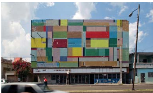
Cinecito, La Habana, 2006