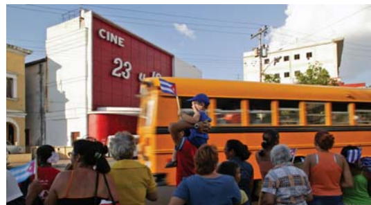
Cinecito, La Habana, 2006