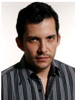
Santiago Reyes « natures mortes et Still Life »

Installation interactive ? Les spectateurs seront vivement invités à participer aux deux installations, à les revisiter en se servant d'indications évasives, à l'image des tablatures musicales, laissées par l'artiste sur des feuilles blanches pour faciliter un nouveau travail de post-production qui dépassera le temps d'exposition.