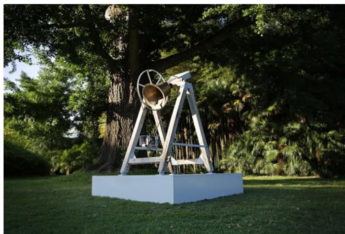
« Cloche » © Arno Fabre 2013

Pour cette neuvième édition de la Nuit Pastel, le Centre d'art Le LAIT invite Arno Fabre, pour un parcours d'œuvres à multiples facettes: entre performance sonore, sculptures, et interventions dans l'espace public.