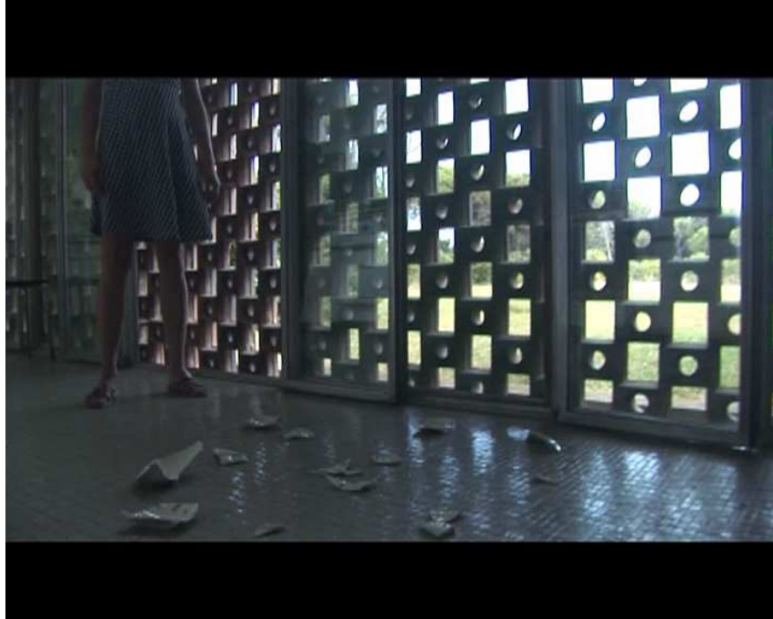
©François Curlet extrait du film La Ricarda, familia Gomis Bertrand