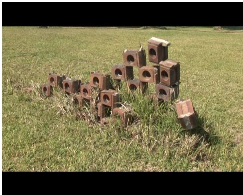
©Richard Venlet extrait du film La Ricarda, familia Gomis Bertrand