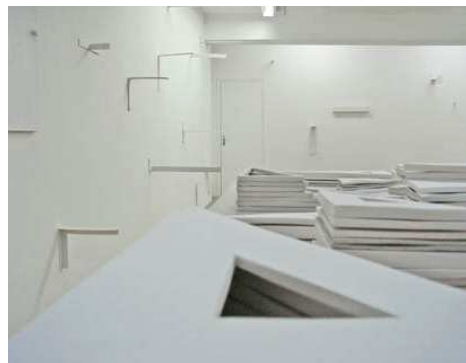
équerre, je suis l'espace où je suis, 2004 - 2005