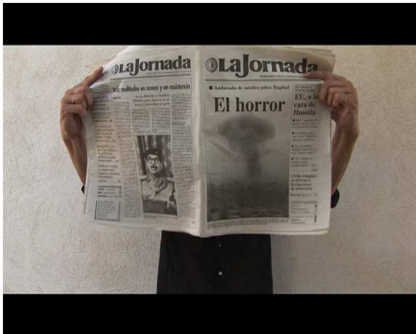
©Michel François extrait du film La Ricarda, familia Gomis Bertrand