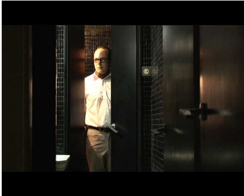
©Loic Vanderstichelen extrait du film La Ricarda, familia Gomis Bertrand