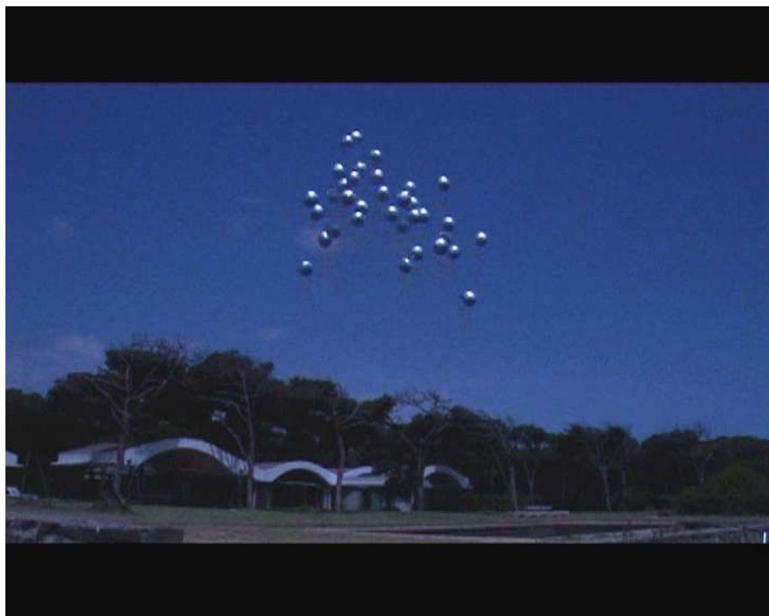
©Simon Siegmann extrait du film La Ricarda, familia Gomis Bertrand