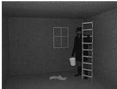
Sans titre, 2006