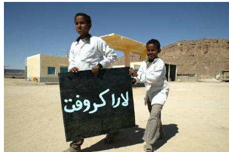
Arabian stars, 2005

Les fictions de Jordi Colomer sont alors attentives au quotidien dans ce qu'il porte d'indications sociologiques, psychologiques et philosophiques, mais aussi dans ses dérapages, ses incongruités ou ses évidences trop oubliées.