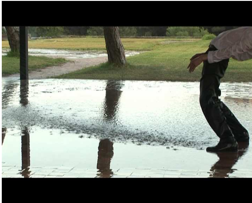
©Pierre Droulers extrait du film La Ricarda, familia Gomis Bertrand