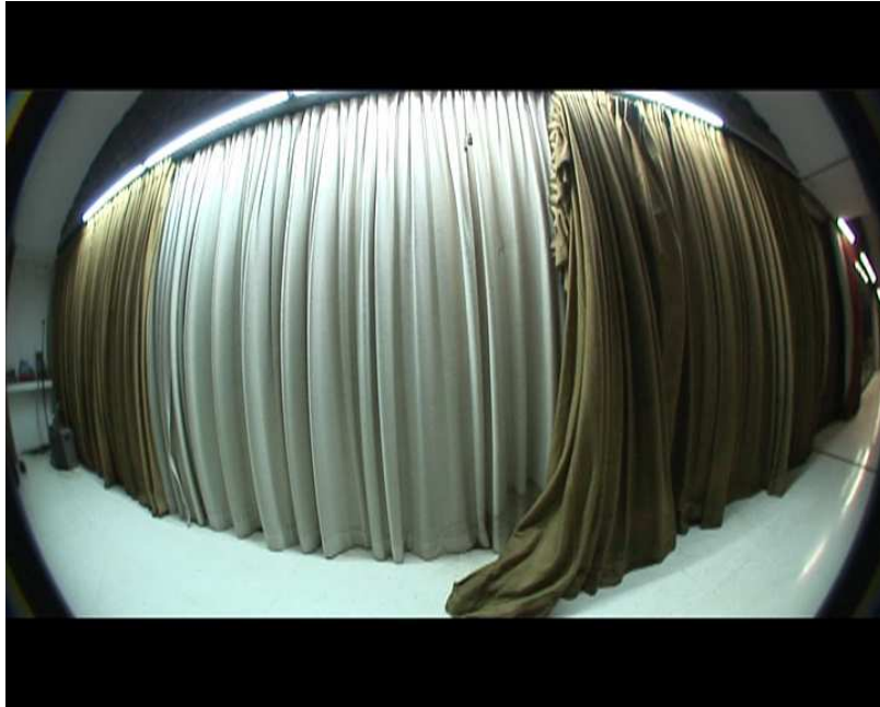
©Ann Veronica Janssens, extrait du film « La Ricarda » familia Gomis Bertrand