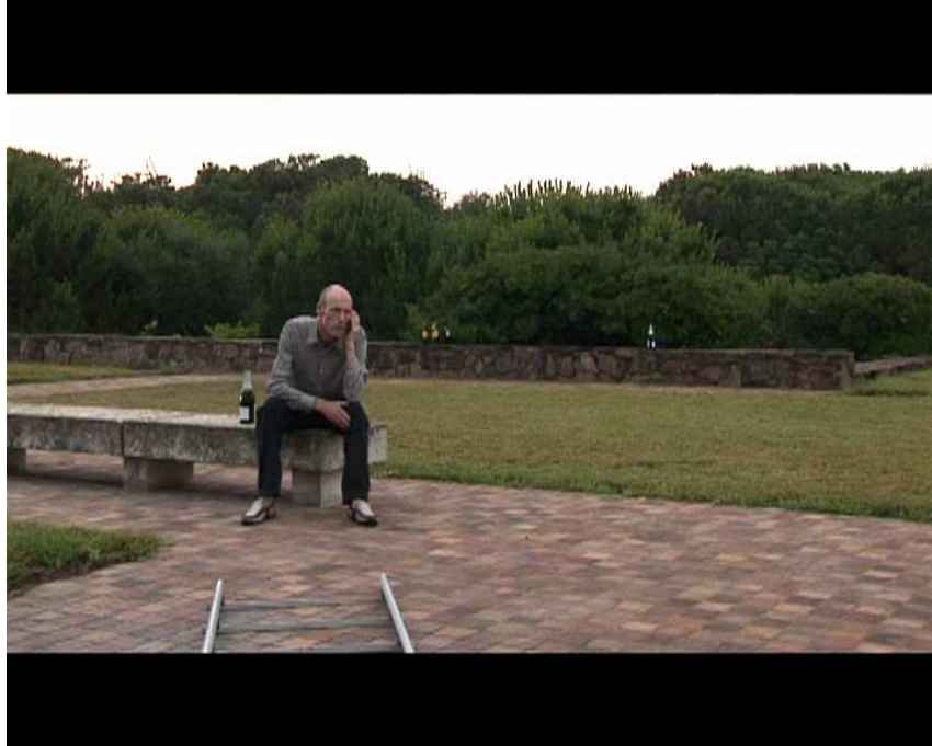
©Joerg Bader extrait du film La Ricarda, familia Gomis Bertrand