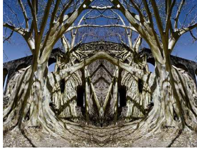
Déjà-vu (cactus 1), 2003