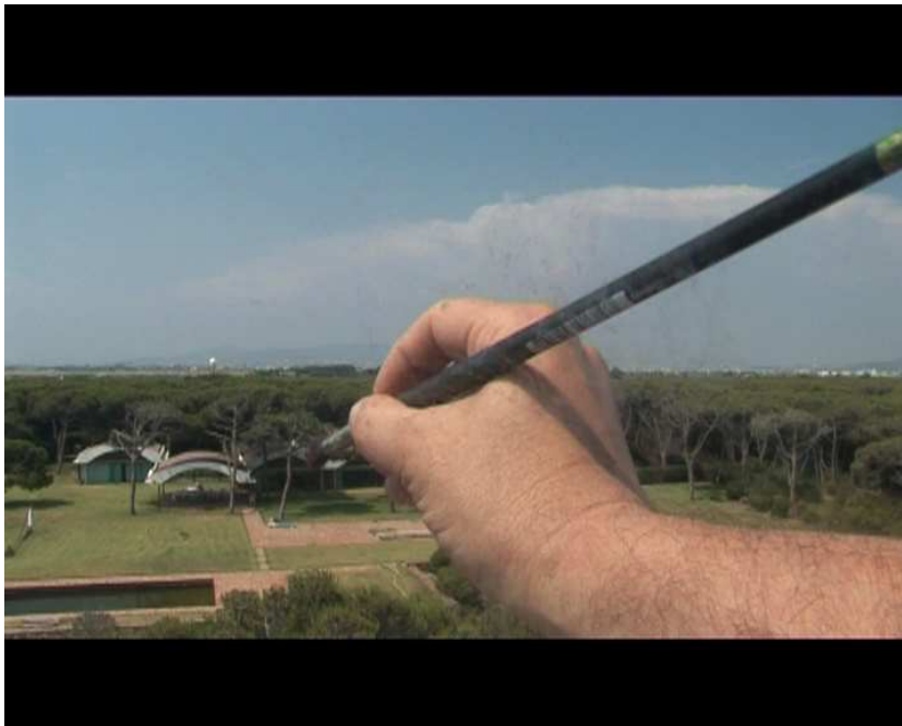
©Angel Vergara extrait du film La Ricarda, familia Gomis Bertrand