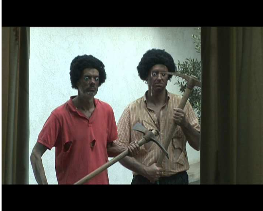
© Harald Thys & Jos de Gruyter extrait du film La Ricarda, familia Gomis Bertrand