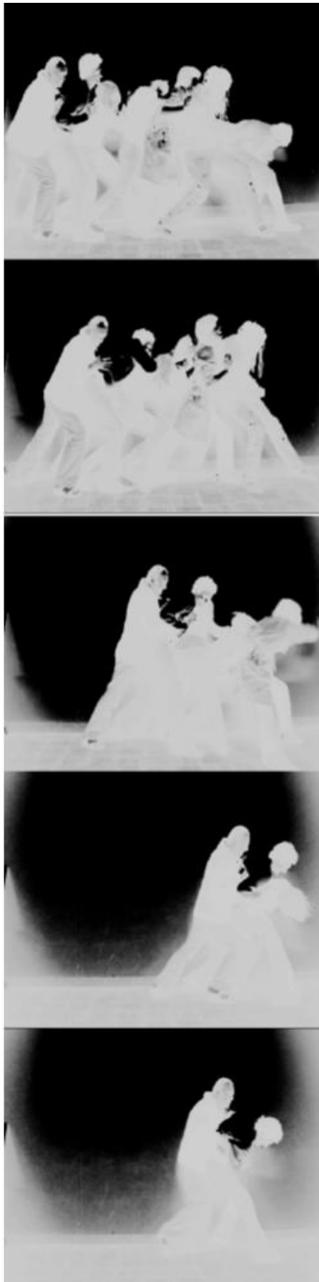
« Push » Vidéo Performance 5 min 49 en boucle Paris, 2007