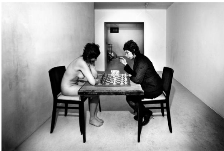
« Hors je » Tirage Numérique 40 X60 cm Paris, Galerie De DI BY 2007