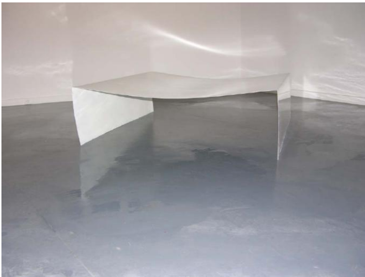
Espace de projection inactive Sculpture d'acier plié et laqué 150 X 150X 45cm Paris, 2007