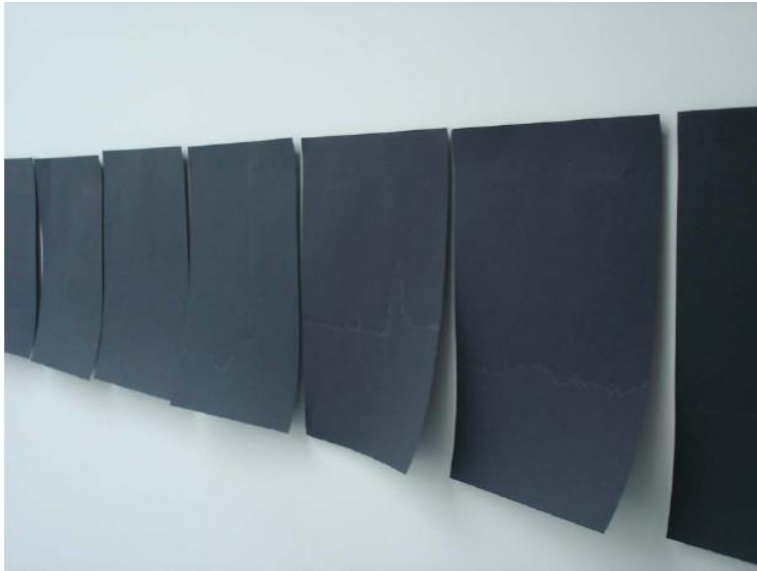
Paris IXème, 21X29,7cm Dessin au crayon sur papier noir Paris, 2007

Cette série de dessins a été réalisée d'après des vues filmées sur le toit de mon atelier à Paris IXème. Elle traduit mes errances nécessaires, afin de chercher et de fouiller du regard l'ailleurs. L'ailleurs comme sujet et perte de sujet. Pour cette série de dessins, j'ai placé sur le toit la caméra au niveau de mes yeux et j'ai commencé à tourner sur moi-même pendant dix tours. Puis, j'ai extrait les images et commencé à tracer les contours des bâtiments et de la ligne d'horizon au crépuscule. Les images se formaient pour moi à chaque fois que je fermais les yeux. Il m'est juste apparu une ligne discontinue sans fin, fil infini d'une histoire sans fin.