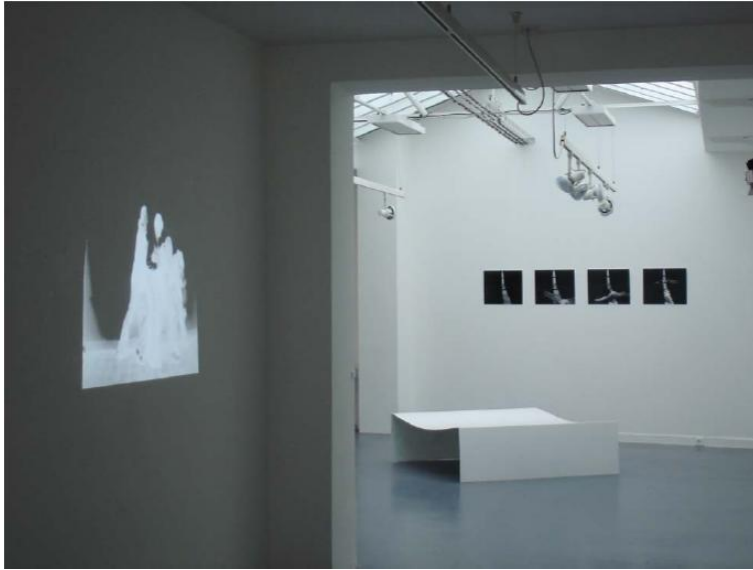
Vue d'ensemble Exposition dans la Galerie Premier Regard Paris, 2007