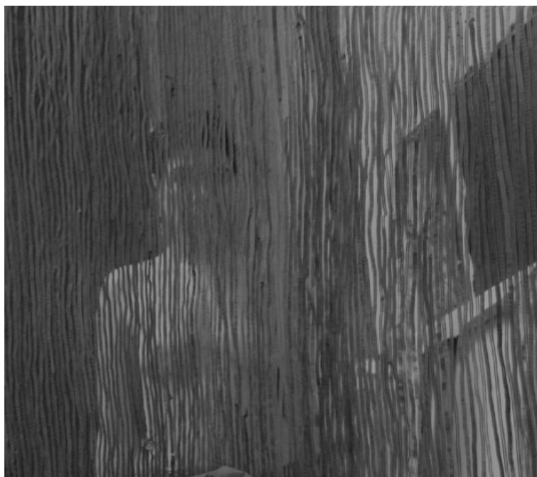
Autoportrait Tirage numérique 20X22 cm Paris, 2007