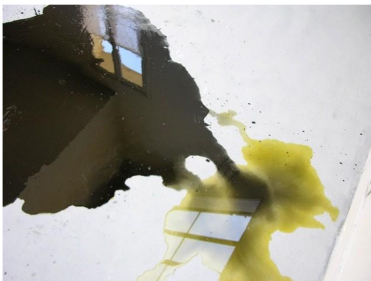
Limites floues ©Anahita Bathaie

Anahita Bathaie incarne dans son travail la complexité des tensions qui maquillent sa vie entre un ici et un ailleurs social, culturel et personnel.