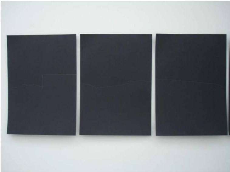
Détail de dessin au crayon 21X27 cm Paris 2007

Cette série de dessins a été réalisée d'après des vues filmées sur le toit de mon atelier à Paris IXème. Elle traduit mes errances nécessaires, afin de chercher et de fouiller du regard l'ailleurs. L'ailleurs comme sujet et perte de sujet. Pour cette série de dessins, j'ai placé sur le toit la caméra au niveau de mes yeux et j'ai commencé à tourner sur moi-même pendant dix tours. Puis, j'ai extrait les images et commencé à tracer les contours des bâtiments et de la ligne d'horizon au crépuscule. Les images se formaient pour moi à chaque fois que je fermais les yeux. Il m'est juste apparu une ligne discontinue sans fin, fil infini d'une histoire sans fin.