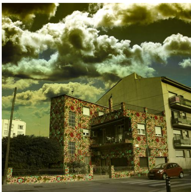
Manel Bayo, Cop de flors , vidéo, couleur, son, 10', 2014