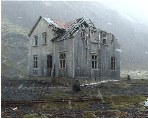
Simon Faithfull (Angleterre) Stromness , 2005 Video, 12'

Stromness walking station est une autre vidéo de l'expédition, tournée lors d'une courte halte à Stromness, sur la côte nord de la Georgie du Sud. Stromness est une ancienne station de chasse à la baleine abandonnée depuis les années 1960. Faithfull a filmé sur le vif en peu de temps cet endroit désert – ou presque – puisqu'une colonie d'otaries a envahi les lieux en ruines. Cette vidéo aux images rares (l'endroit est en effet interdit d'accès) offre une vision sublime, où la présence de l'homme est devenue fantomatique et où la nature reprend ses droits.