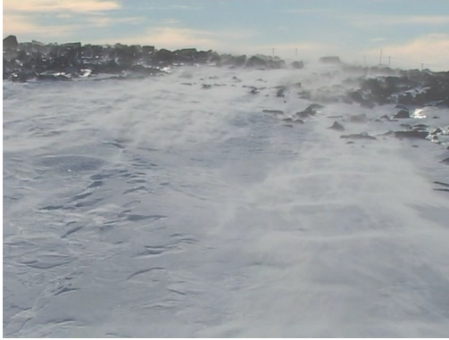
Thomas Mulcaire (Afrique du Sud) Study for Solaris , 2007 Video 6'35"

Thomas Mulcaire use des technologies numériques et électroniques pour traiter des surfaces planes. La lumière est au cœur de son travail: il explique qu'elle agit comme un déferlement sur le visiteur ou au contraire un éloignement. Cette vidéo est faite de lumières, elle joue avec les surfaces, les textures, les densités, et avec la perception du visiteur, dans le silence et le bruit... Fluidité et inéluctabilité vont de pair pour cette ode à la glace.