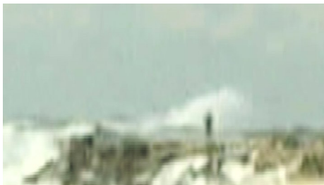
Marcellvs L. (Brésil) 1716, 2009 MiniDV in DVD, 7'12"