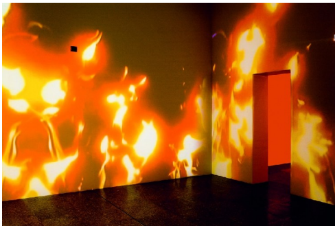
Eugenio Ampudia (Espagne) Fuego Frio I , 2003 Video, 6'16"