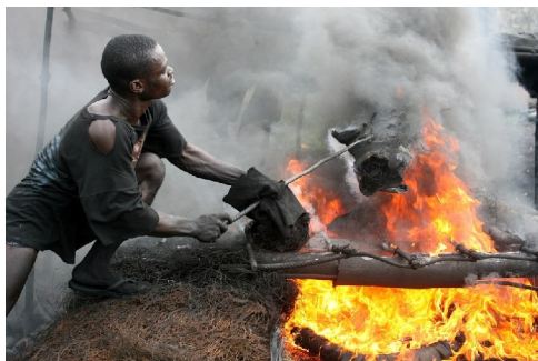
George Osodi (Nigeria) Oil Rich Niger Delta , 2007 Courtesy Galerie Ziggi Golding London