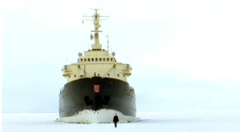
Guido van der Werve, Nummer acht : everythingis going to be alright , 2007 16mm sur DVD, couleur, sonore, 10'09".

En partenariat avec le Goethe Institut de Rio de Janeiro et de Toulouse et le Forum de l'Image